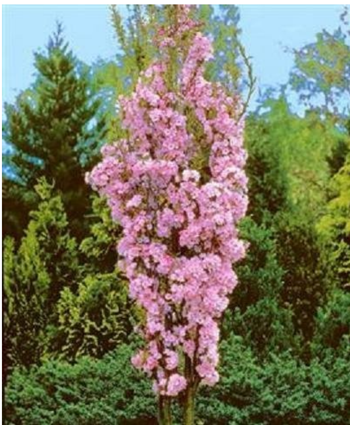
Prunus serrulata 'Amanogawa'

No necesita ser podado , salvo para eliminar las ramas viejas o mal orientadas. Nunca cortar ramas gordas porque no lo soporta. La plaga que más le afecta es el pulgón.