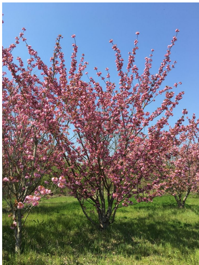
Prunus serrulata 'Kanzan'