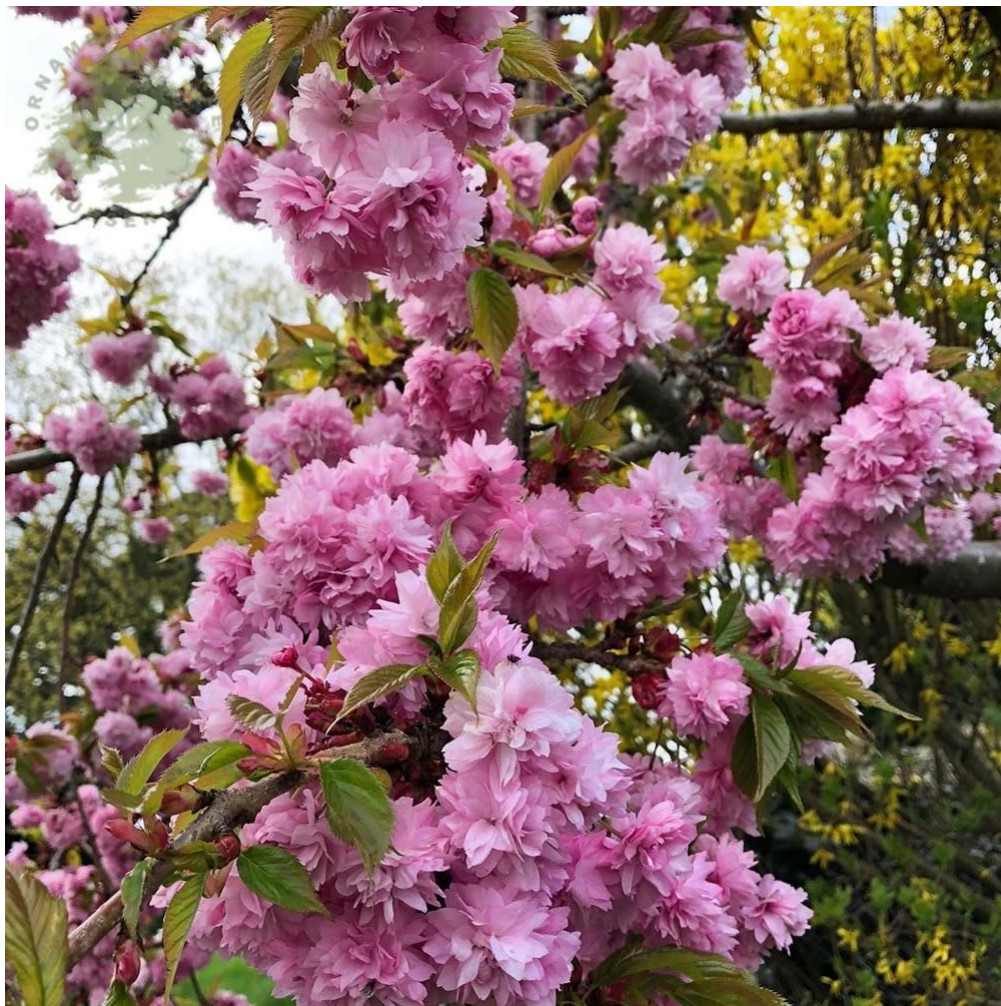
P. serrulata ‘Kiku-Shidare-Zakura’ pendula. Presente en el Arboretum.