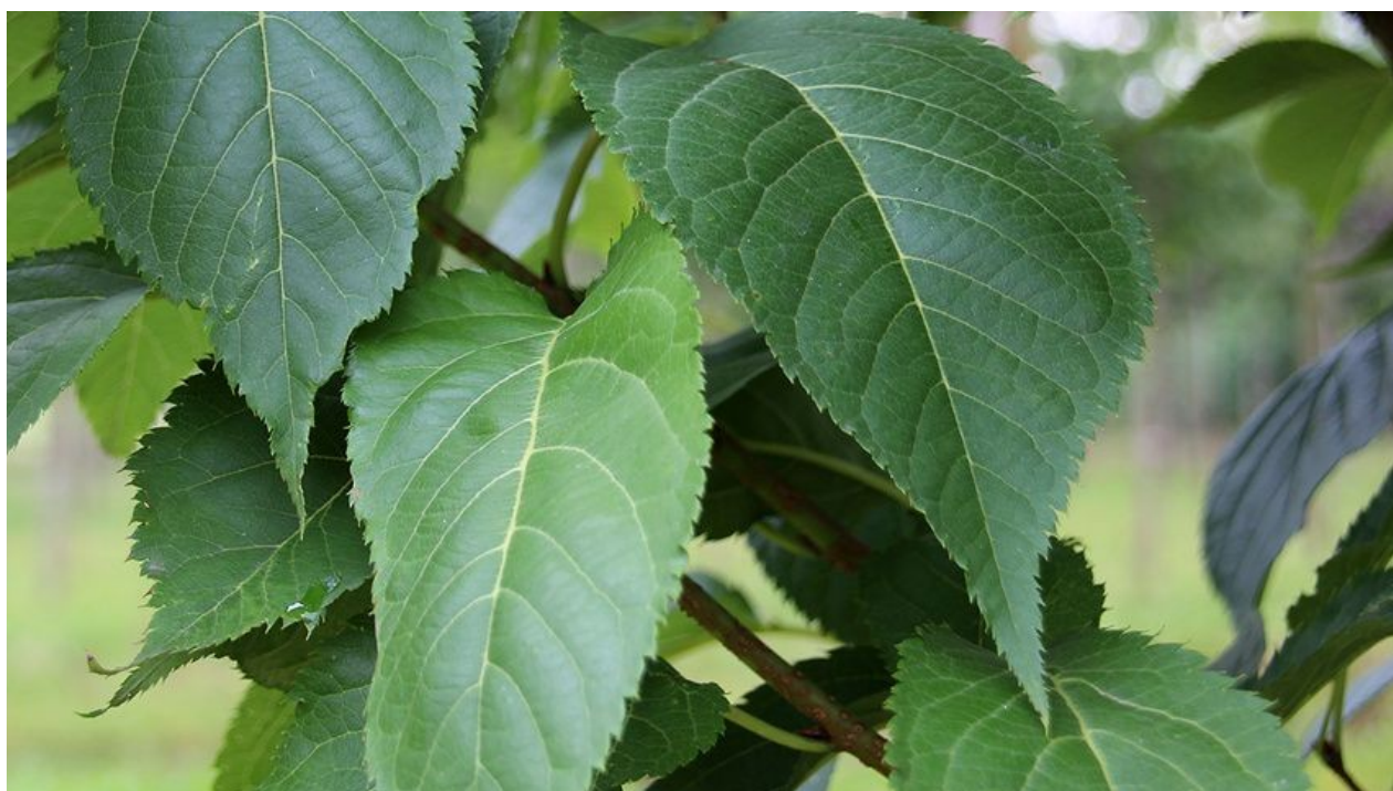
Prunus serrulata 'Amanogawa', hojas.